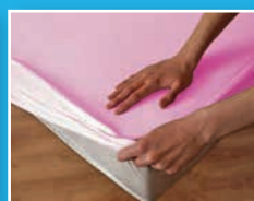
Jasny Róż 05